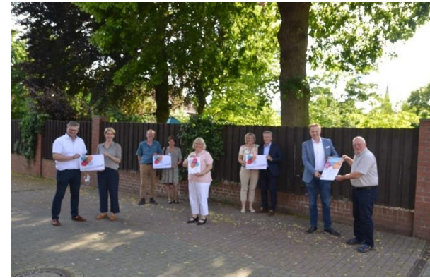
Ziel und Anspruch definieren